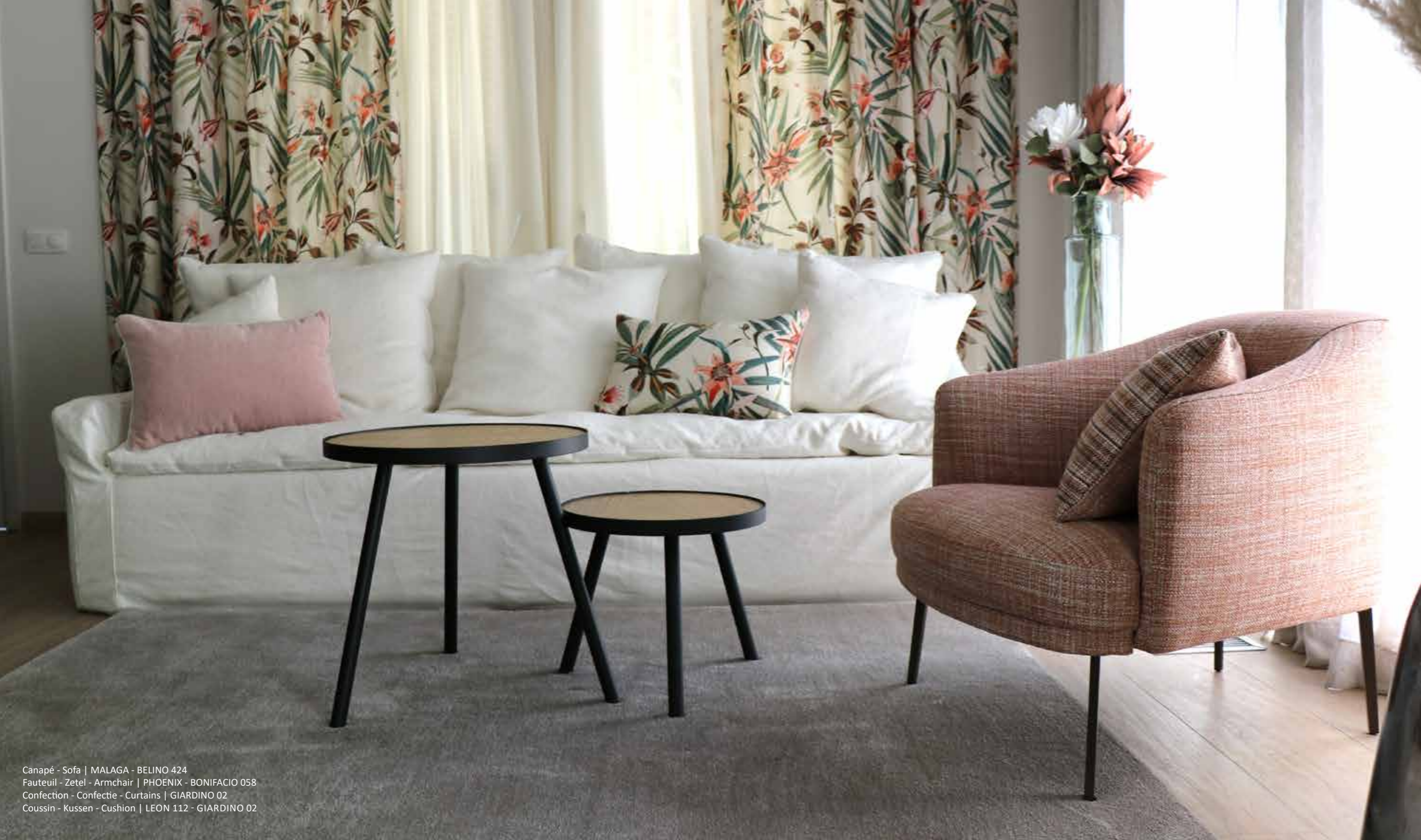
Canapé - Sofa | MALAGA - BELINO 424 Fauteuil - Zetel - Armchair | PHOENIX - BONIFACIO 058 Confection - Confectie - Curtains | GIARDINO 02 Coussin - Kussen - Cushion | LEON 112 - GIARDINO 02