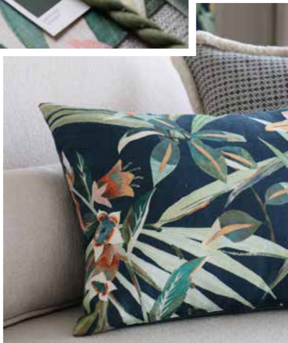
Canapé - Sofa | MALAGA - BELINO 424 Confection - Confectie - Curtains | GIARDINO 02 Coussins - Kussen - Cushions | GIARDINO 01 - 02