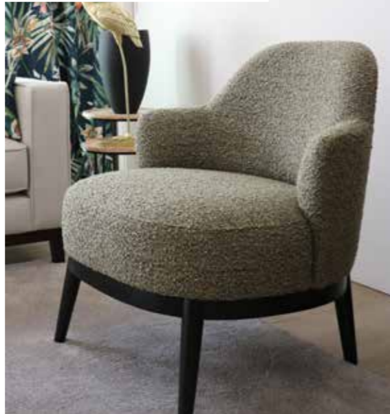
Fauteuil - Zetel - Armchair | RIGA - MERINO 004