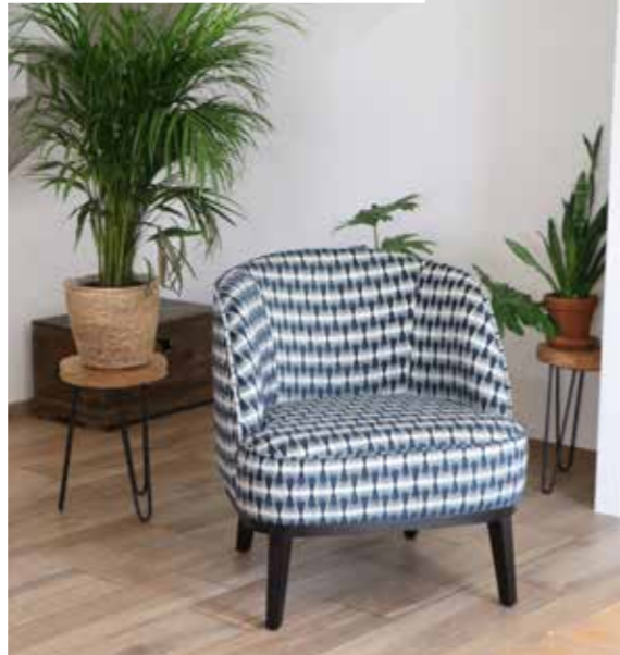
Canapé - Sofa | MISSOURI | LEON 102 Fauteuil - Zetel - Armchair | VENICE | PANKA 11 Confection - Confectie - Curtain | PAPHOS 23 Coussins - Kussens - Cushions | PANKA 11 - LEON 102