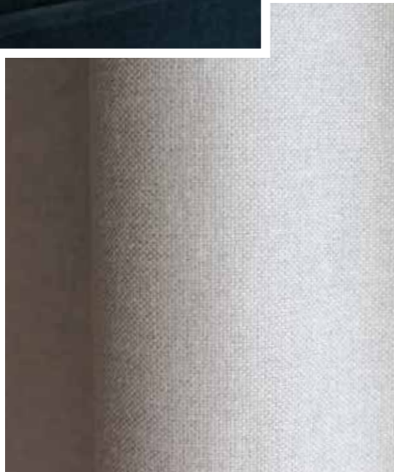
Canapé - Sofa | MISSOURI | LEON 102 Fauteuil - Zetel - Armchair | VENICE | PANKA 11 Confection - Confectie - Curtain | LANOSA 091