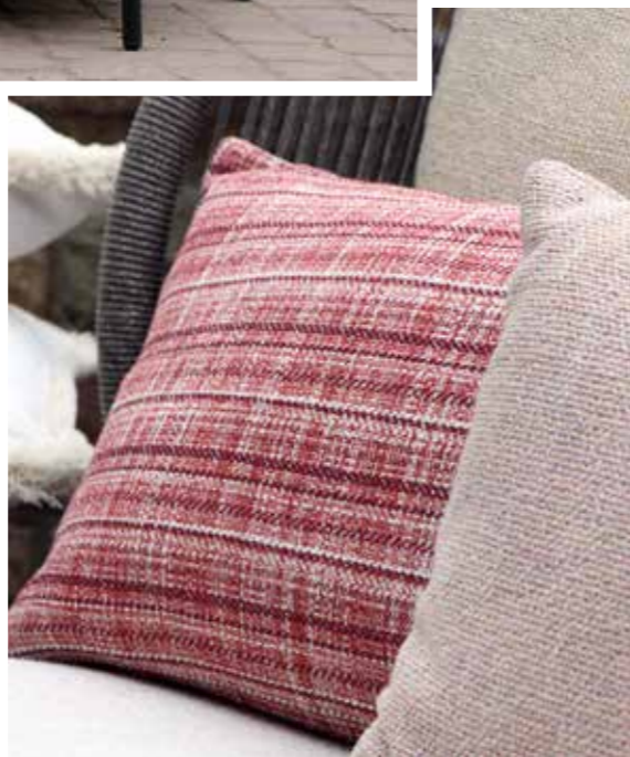
Fauteuil - Zetel - Armchair | KODO - Vincent Sheppard | CAGLIARI 01 - CAGLIARI 02 - CAGLIARI 04