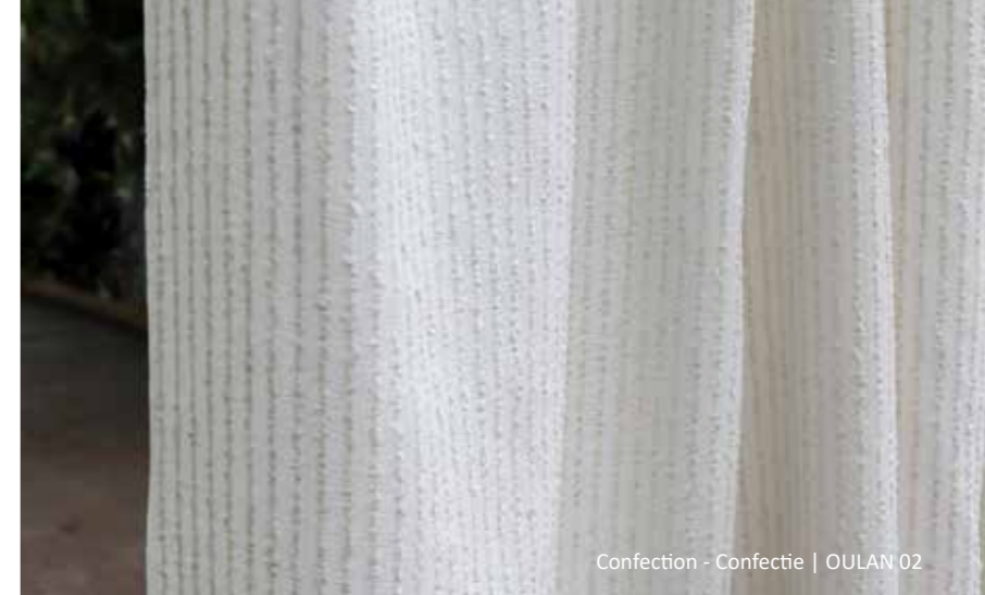
Confection - Confectie | OULAN 02