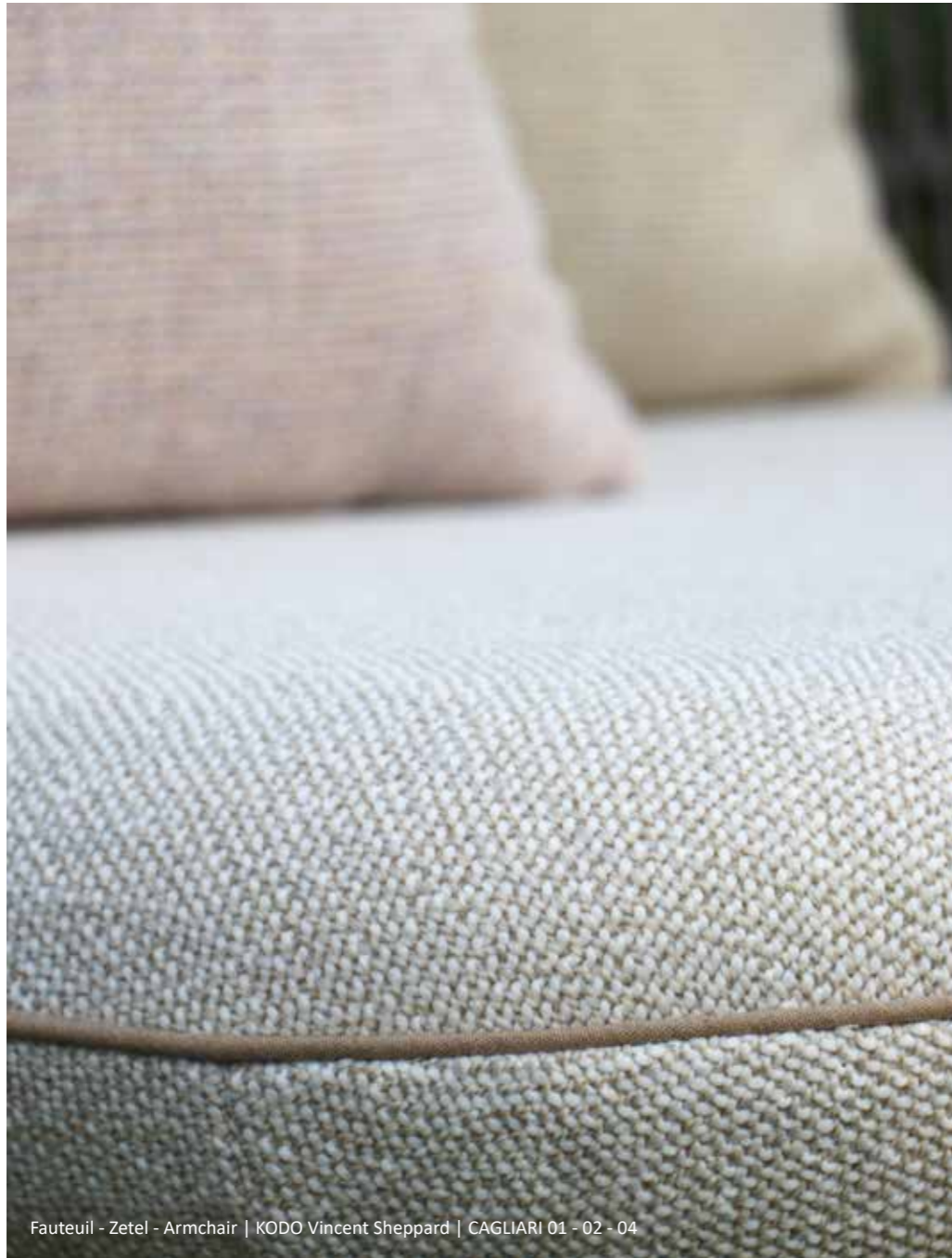
Fauteuil - Zetel - Armchair | KODO Vincent Sheppard | CAGLIARI 01 - 02 - 04