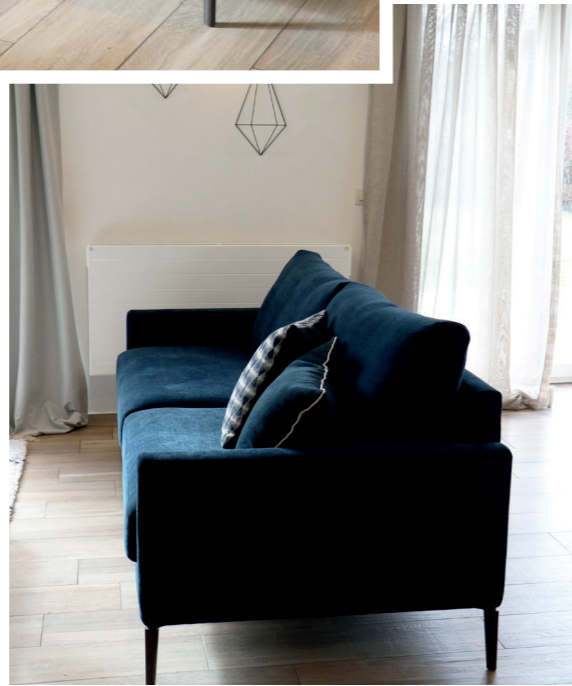
Canapé - Sofa MISSOURI | LEON 102 Fauteuils - Zetels VENICE | PANKA 11 Confection - Confectie | LANOSA 91 Coussins - Kussens | PANKA 11 - LEON 102