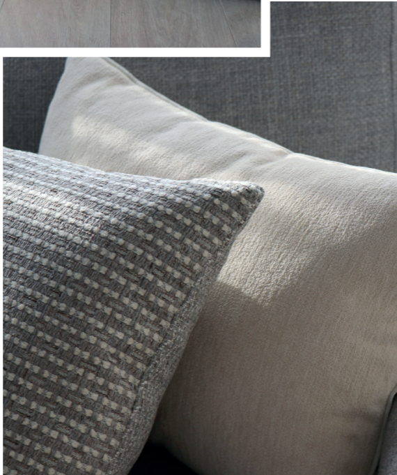
Canapé - Sofa CALIFORNIA | ORTISEI 16 Fauteuils - Zetels PHOENIX | NAZCA 410 Confection - Confectie | ILLUSION 813 Coussins - Kussens | NAGOR 4203 - LEON 111